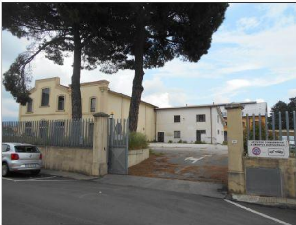
VISTA PROSPETTO FRONTALE FABBRICATO 1