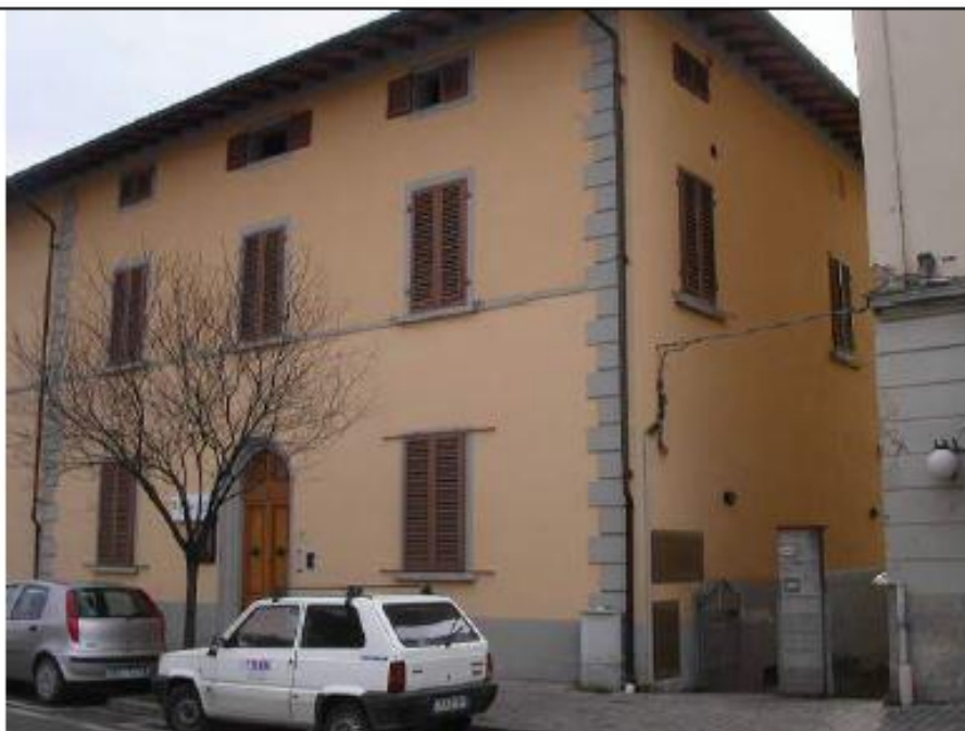
Foto n. 2 - Retro dell'edificio con ampio piazzale di parcheggio